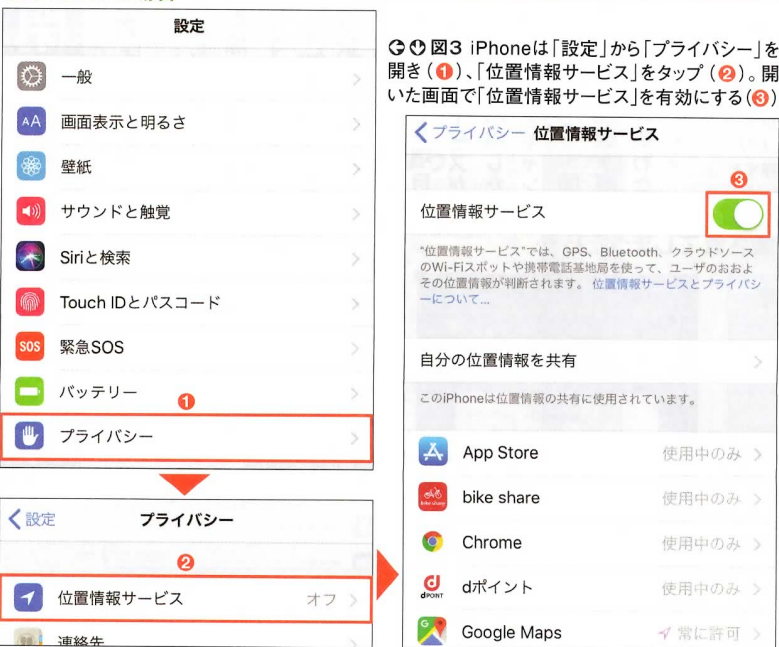
図3 iPhoneは「設定」から「プライバシー」を開き(1)、「位置情報サービス」をタップ(2)。開いた画面で「位置情報サービス」を有効にする(3)